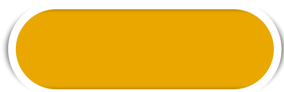
AM. OURO N° 01