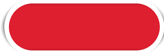
VERMELHO N° 14