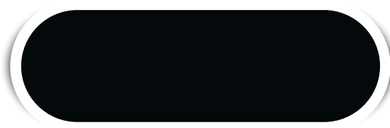
PRETO N° 12