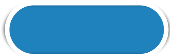
CELESTE N° 07