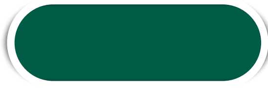
VD. BANDEIRA N° 16