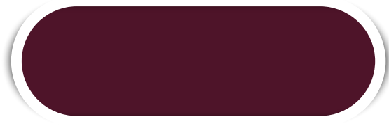
VINHO N° 15