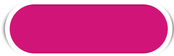
PINK N° 11