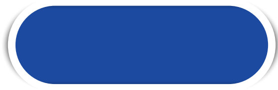
ROIAL N° 13