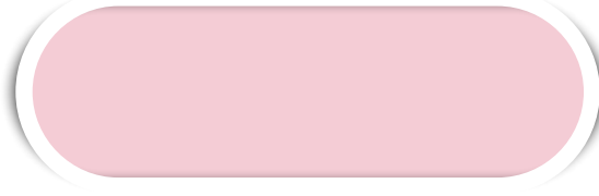
ROSA N° 30