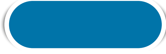
TURQUESA N° 133